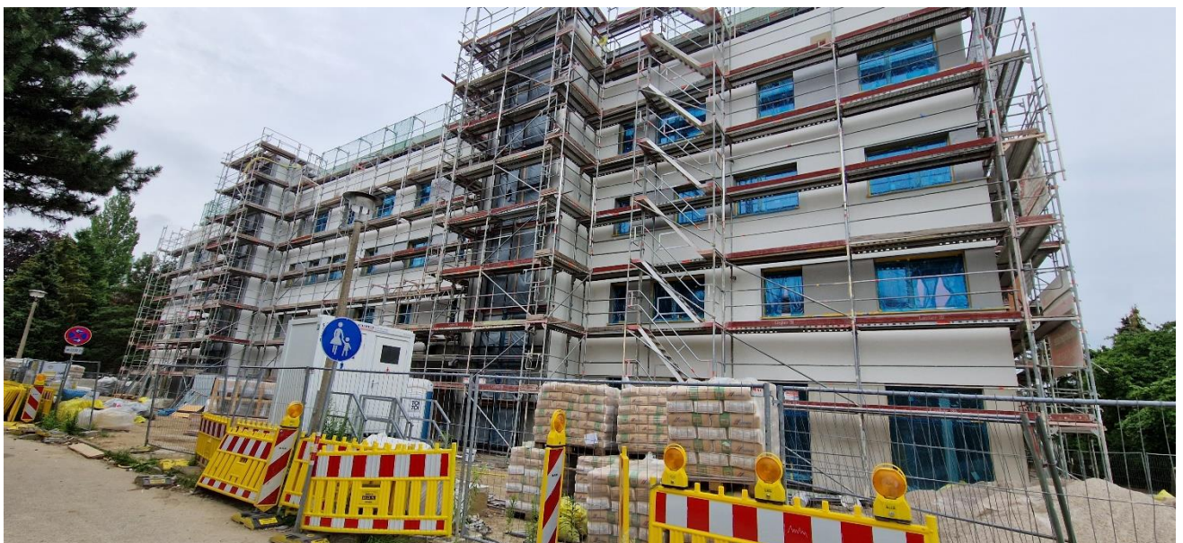
WDVS Fassade geputzt