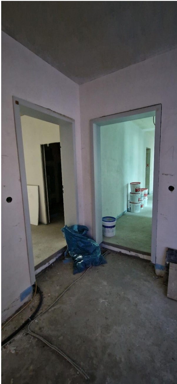
Zargeneinbau Haus A WE Türen