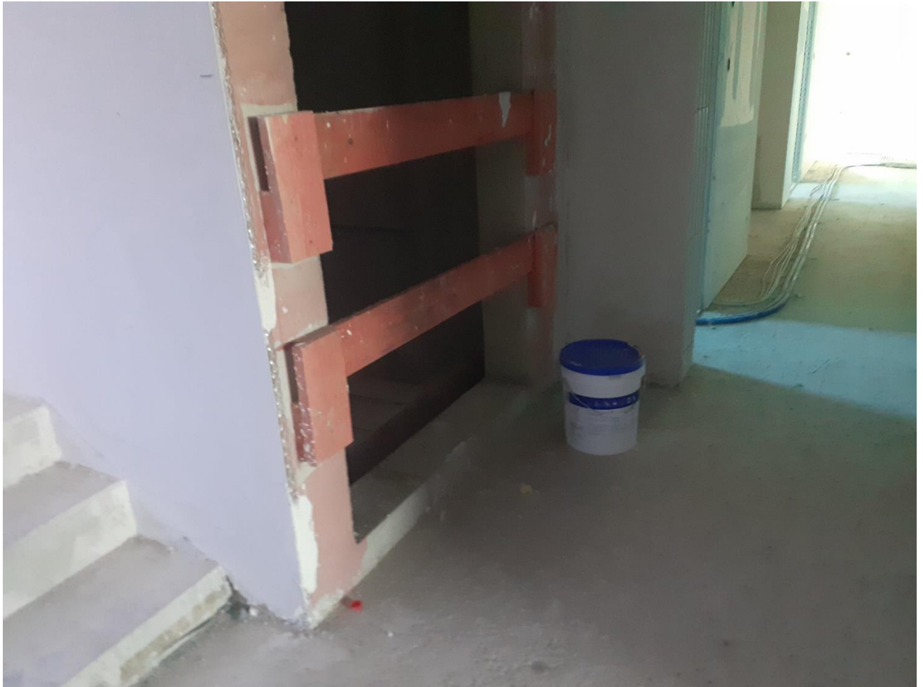
Anlieferung und Beginn Aufzugsmontage