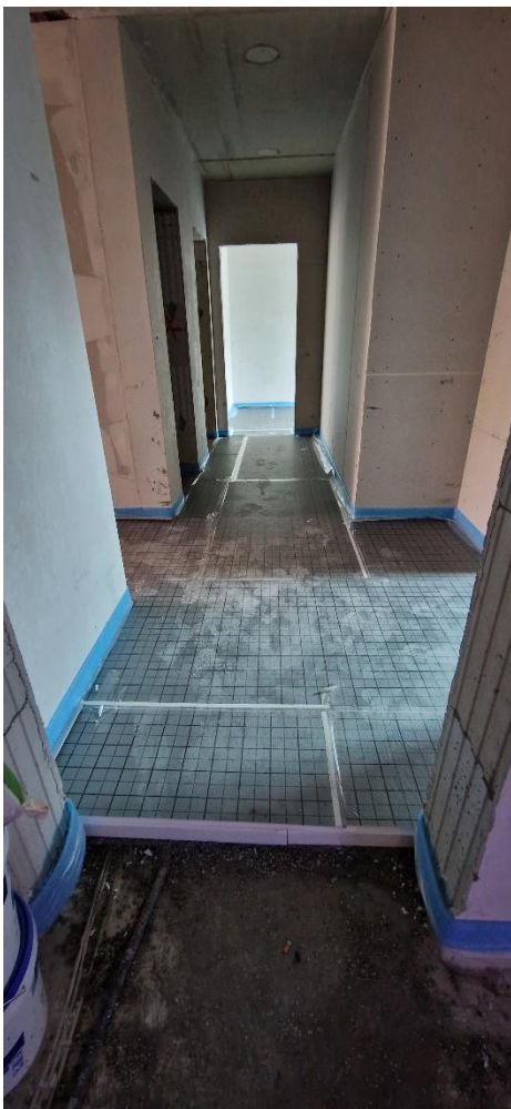
Vorbereitung FB-Heizung Haus B